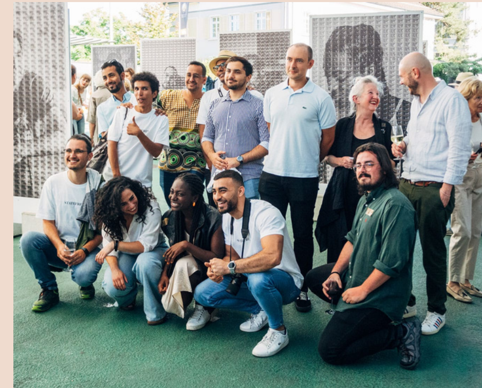
associazione no-profit nata nel 2021 in Germania