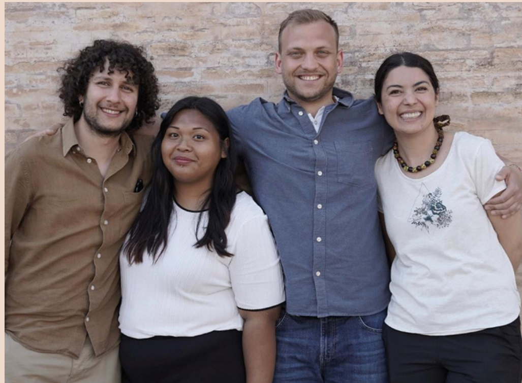
associazione no-profit nata nel 2022 in Italia