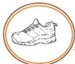
scarpina (una scarpa piccola)