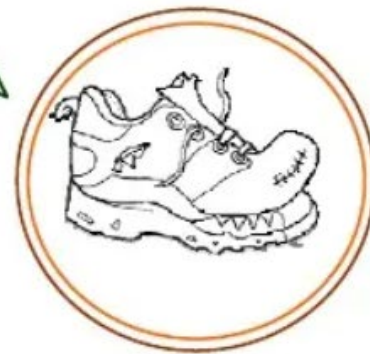
scarpaccia (una scarpa molto usata e rotta)