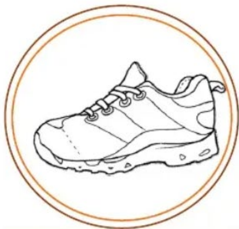
scarpona (una scarpa grande)