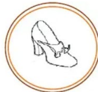
scarpetta (una scarpa piccola e graziosa)